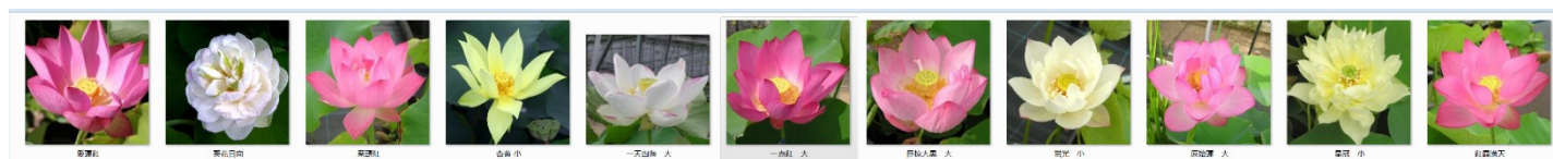
愛蓮紅 葵花日向 案頭紅 杏黄 一天四海 一点紅 巨椋大黒 蛍光 原始蓮 皇冠 紅霞満天